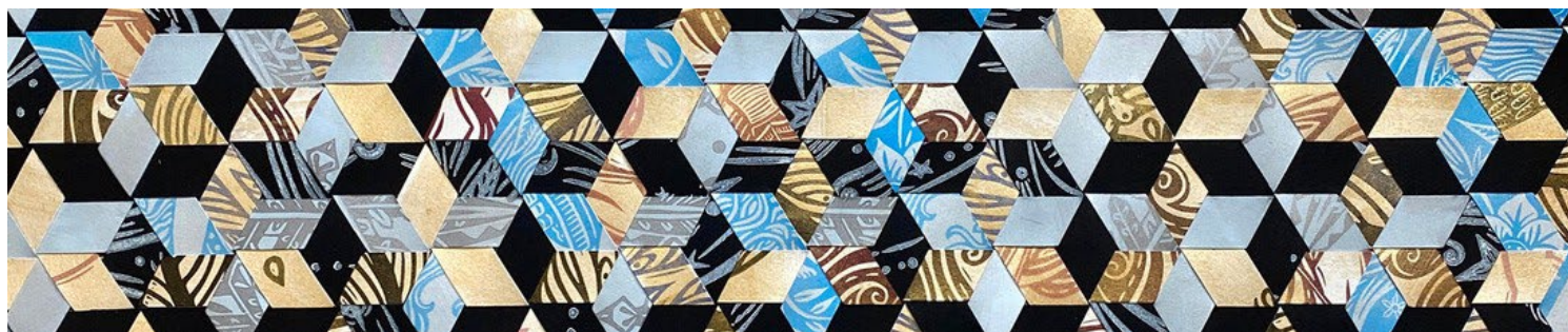
Ilustración de Jill Bergman