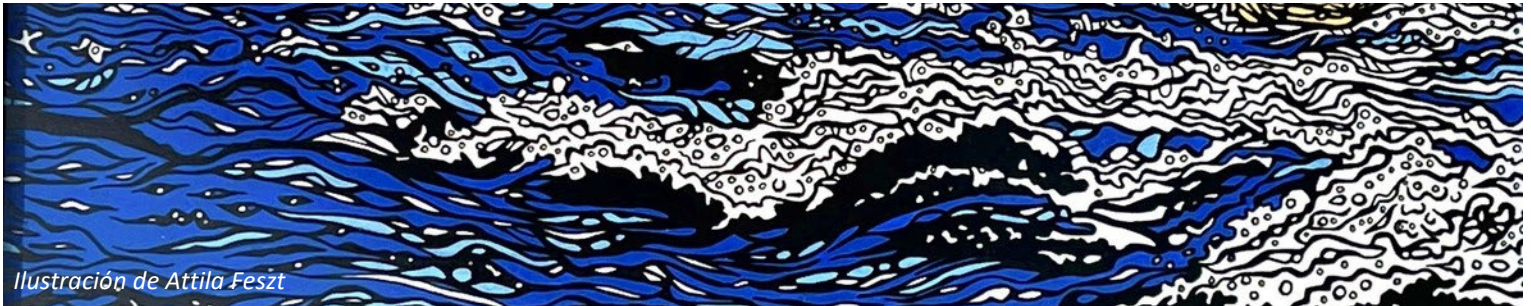
Ilustración de Attila Feszt

A lo largo de este proceso, fomentamos el uso de materiales y medios reutilizados, reciclados o producidos de forma sostenible, prestando atención especial a aquellos que pueden obtenerse localmente. A continuación, se muestra una lista de recursos de materiales y suministros que pueden serle útiles a medida que crea su pieza.